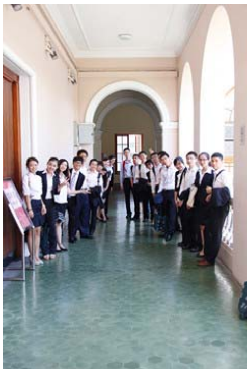
参观港大校园——陆佑堂