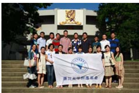
参访香港中文大学