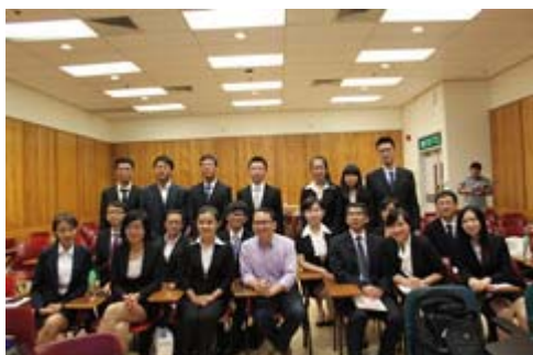
与授课教师合影一