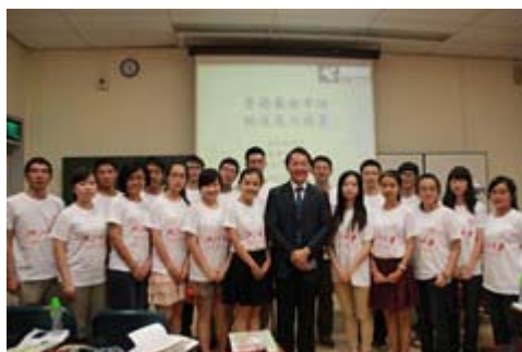
与授课教师合影二