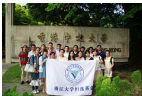
香港中文大学合影